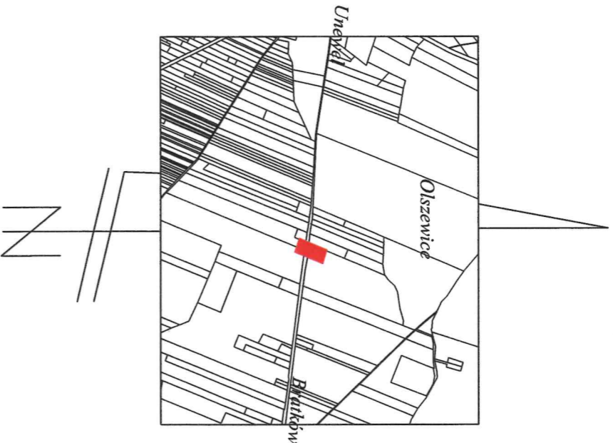
Szkieł orientacji Skala 1 : 20 000

Uwaga: Nowowydzielona działka 286/1 zostanie przeznaczona na powiększenie sąsiedniej nieruchomości - działki 279. Działki 286/1 i 279 będą stanowić jedną nieruchomość.